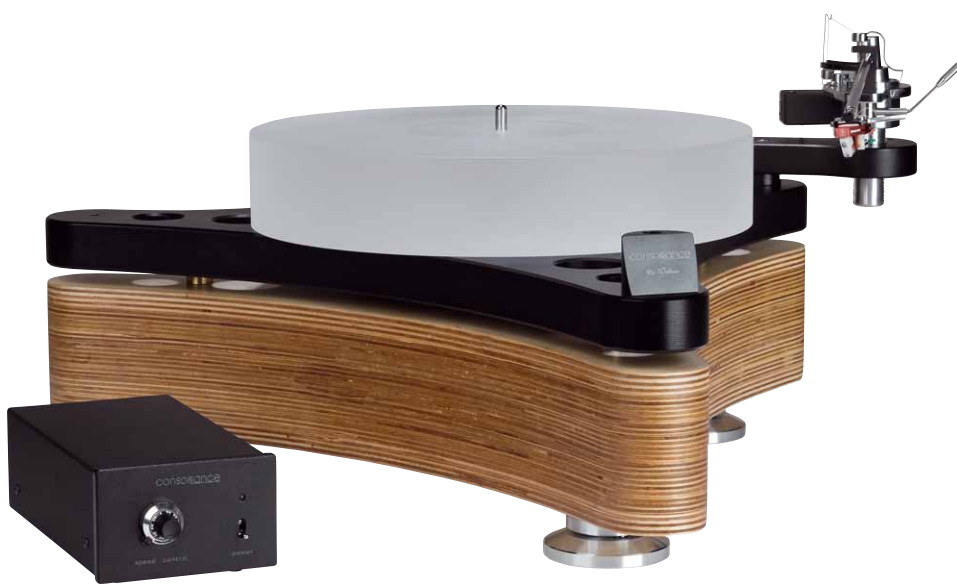
„Die Walküre“ – so heißt der neue Plattenspieler von Opera Consonance

Plattenspieler der gehobenen Klasse aus China? Das ist selten. Sehen wir uns doch mal an, was da heutzutage so möglich ist